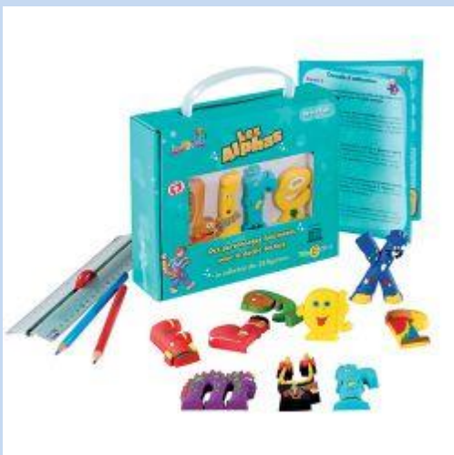
Les Alphas, aide à la lecture. Hoptoys